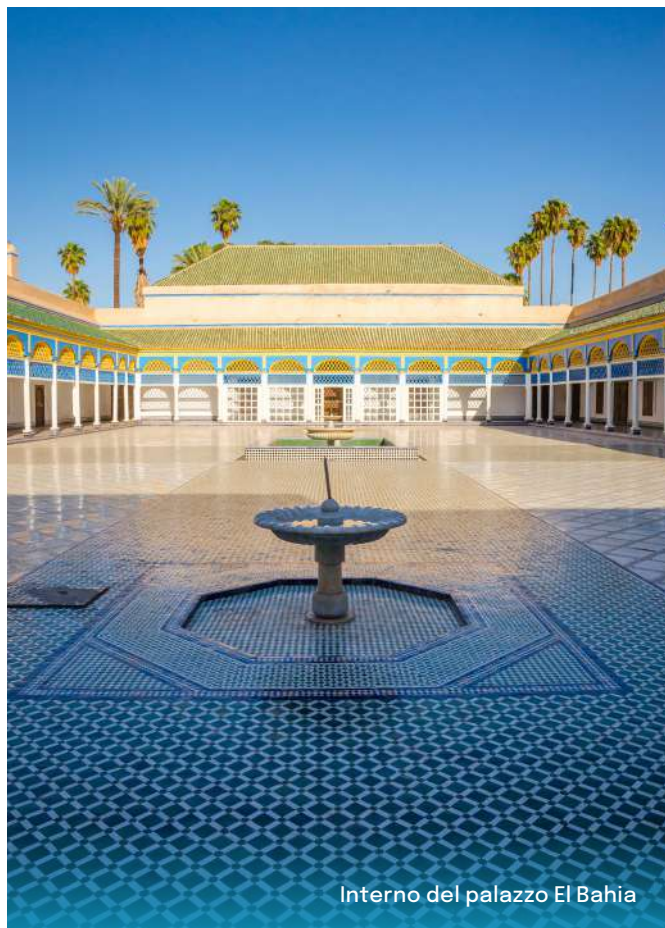
Interno del palazzo El Bahia

Con il suo fascino, la città rossa non mancherà di sedurre anche i viaggiatori più esigenti. I siti di maggiore interesse sono la medina e le famose mura della città vecchia che si estendono per 19 chilometri; la Kutubyya, minareto che data del XII secolo nonché simbolo della città; il palazzo El Bahia del XIV secolo e infine la piazza Jamaa el Fna, cuore di Marrakech, con i suoi acrobati, i suoi incantatori di serpenti e punto di passaggio obbligato per penetrare nel labirinto delle stradine del suq. Pranzo in hotel. Cena e pernottamento a Marrakech.