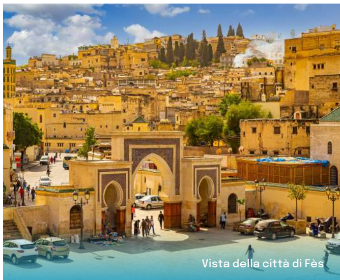
Vista della città di Fès