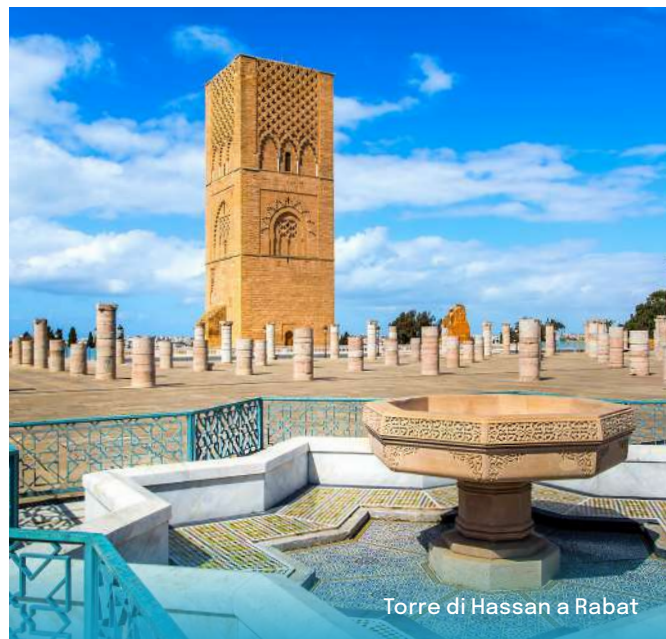
Torre di Hassan a Rabat

Colazione in hotel. Partenza verso Rabat, la capitale amministrativa del paese. Visita della torre di Hassan, le cui quattro facciate presentano tutte una decorazione diversa; del mausoleo di Sua Maestà Mohammed V, simbolo dell'indipendenza nazionale, restaurato nel 1956 e situato nella grandiosa cornice della moschea di Hassan in puro stile arabo-musulmano; il Mechouar, vasta spianata su cui sorge il Palazzo Reale; il giardino di Oudayas, di stile andaluso, autentica oasi di pace e bellezza. Partenza per Meknès. Visita della vecchia capitale di Moulay Ismail: da non perdere le porte monumentali di Bab El Khemis, Bab Mansour, la piazza El Hedhim.