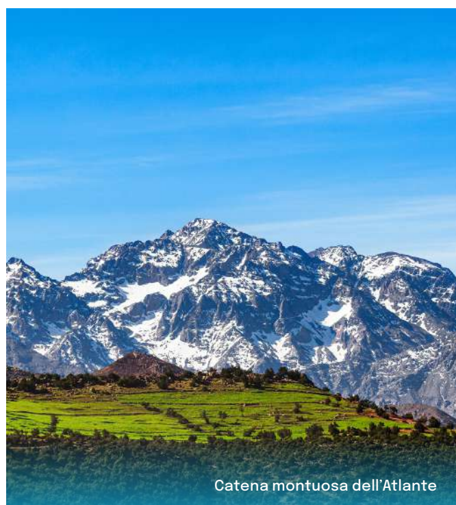
Catena montuosa dell'Atlante